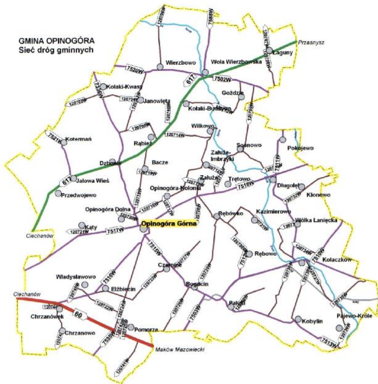
Mapa nr 2 Sieć dróg w gminie Opinogóra Górna