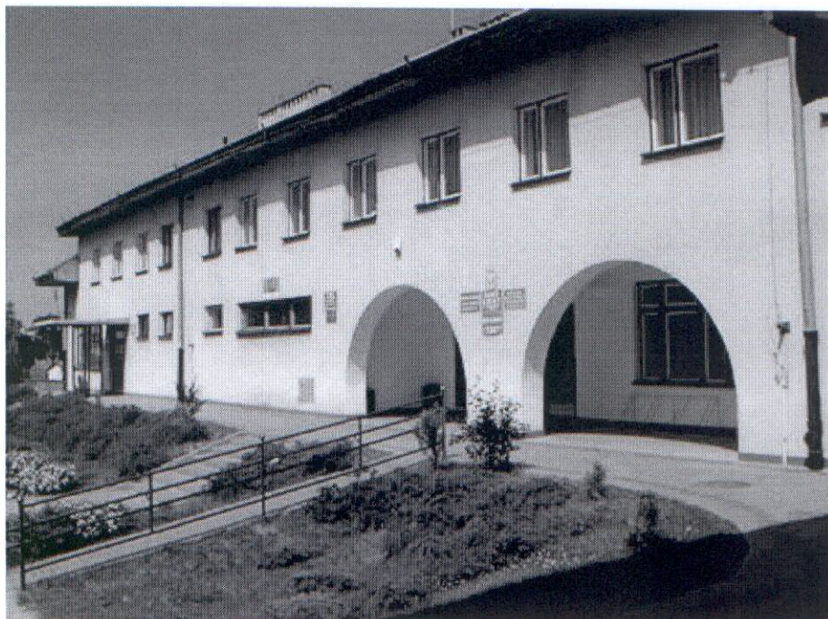
Rysunek 1. Budynek Urzędu Gminy Opinogóra Górna